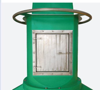
La torre y el compartimento de la batería permiten la incorporación de baterías adicionales y equipos auxiliares para aumentar la autonomía de trabajo de esta ayuda a la navegación en condiciones de poca luz solar.

La Sealite NAUTILUS-2200 es una de las boyas más grandes disponibles fabricadas en una única pieza rotomoldeada en la sección del casco, y representa un valor excepcional para los operadores portuarios de todo el mundo.