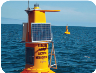
Boyas Nautilus marcan el arrecife artificial ex-HMAS Canberra, Puerto de Phillip Bay, Melbourne, Australia