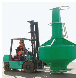
Fácil acceso con máquina elevadora para maniobrar la boya de una forma segura