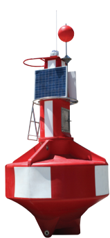
Nautilus-2200 montada con AIS

Sealite tiene una gama de cadenas de fondeo y accesorios- pregunte a su representante como puede suministrarle una solución completa de fondeo